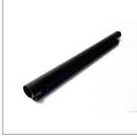
CVON (X3) Prolunga tubo 44 cm