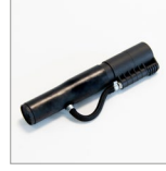
CVK535 Nebulizzatore per impugnatura