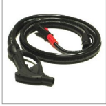
CVP5 Impugnatura 5 mt