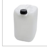
COD0407 Tanica 20 lt