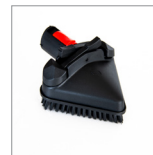
MGK06N Spazzola triangolare vapore

Magic Vapor Sani è una macchina a vapore con sistema in grado di eseguire la sanificazione delle superfici tramite vapore secco e tramite la nebulizzazione a vapore del prodotto disinfettante biocida cod. RIP1519. L'azione disinfettante avviene molto rapidamente e non è necessario risciacquare o passare con un panno. Questo prodotto è VOC Free (non contiene composti organici volatili nocivi), quindi può essere usato da personale qualificato, professionisti e anche da privati.