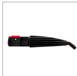
MGK04NC Lancia vapore curva