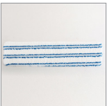
RIP0811/12/13/14 Spazzolino ø28 setole crine per MGK04NC