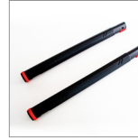
MGK02N (X2) Prolunghe vapore 2 pz