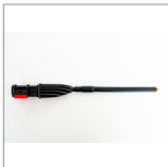
MGK04BN Lancia vapore prolunga ottone 19cm