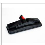
MGK07NV Spazzola rettangolare vap. c/velcro