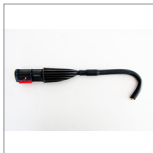
MGK04AN Lancia vapore curva ottone 12cm