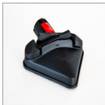
MGK06NV Spazzola triangolare c/velcro vapore