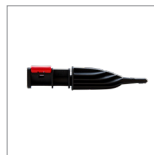
MGK04N Lancia vapore