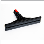
MGK05N Tergivetro vapore