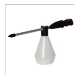
CVK36N Nebulizzatore a vapore