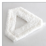
RIP6102 Panno triangolare microfibra velcro bianco