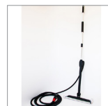
RIP0801 Spazzolone a vapore MOP Tubo 5mt