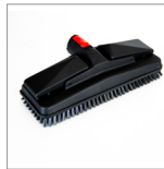
MGK07N Spazzola rettangolare vapore