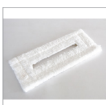
RIP6101 Panno microfibra velcro 330x150 bianco