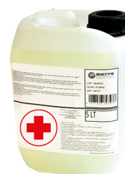
RIP1519 DISINFETTANTE BIOCIDA 5 LT

** La fragranza è priva di allergeni, come da allegato III. del Reg. 1223/2009.