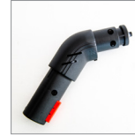
MGK03N Raccordo spazzole vapore