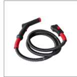
MGK01NW Impugnatura vapore 2 mt