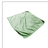
RIP6001 Panno in microfibra 350 GSM 400X400mm