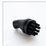
MGLND Spazzolino ø26mm curvo nylon